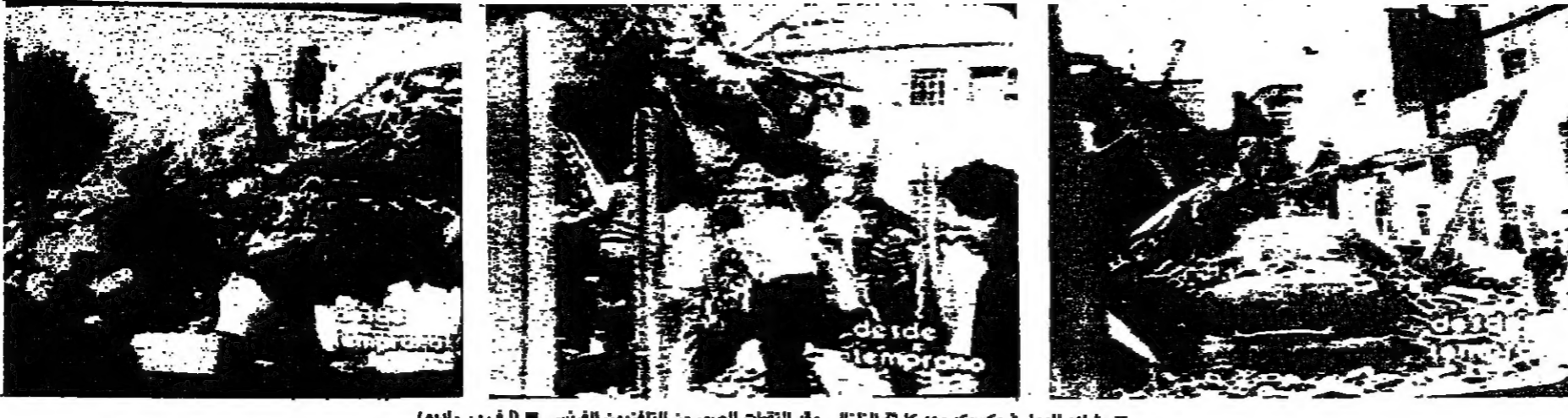
مشاهد للدمار في مكسيكو بعد كارثة الزلزال. وقد التفتت الصور من التلفزيون الفرنسي (أ.ب. راديو)